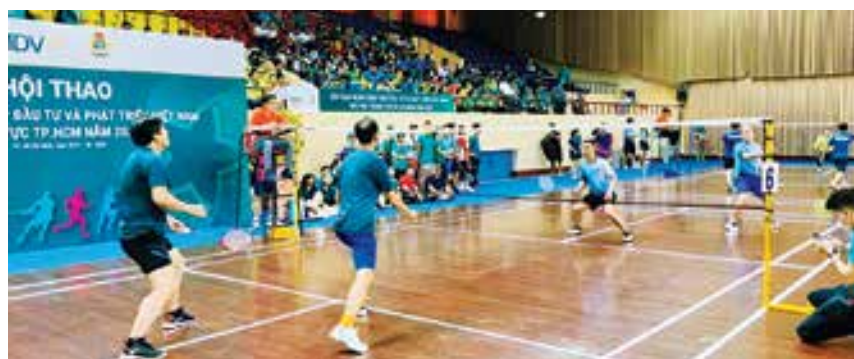
Các VĐV thi đấu môn cầu lông tại Hội thao khu vực TP.HCM