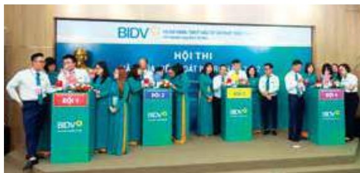
Các đội thi BIDV Long Biên Hà Nội tham gia Hội thi VHKSRR cấp cơ sở

Bên cạnh đó, Hội thi cấp cơ sở chi nhánh còn có thêm phần thi thứ 6: "câu hỏi điểm thưởng" để tạo điều kiện cho các đội có cơ hội lợi ngược