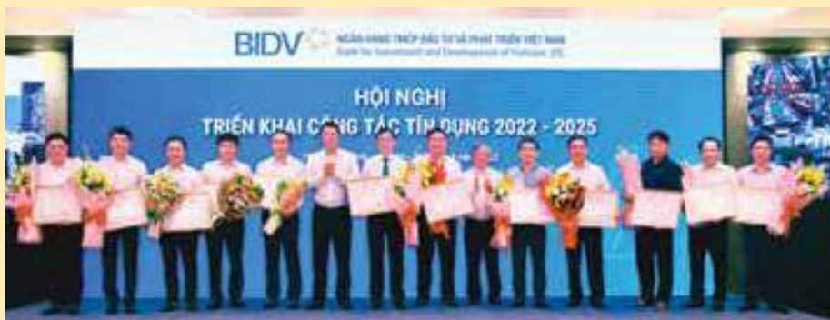
Vinh danh các chi nhánh có nhiều đóng góp trong hoạt động tín dụng