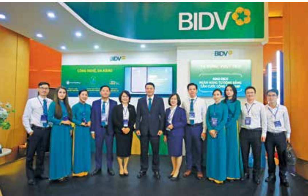
Không gian trải nghiệm số của BIDV tại sự kiện “Chuyển đổi số ngành Ngân hàng”

Trước xu hướng số hóa của nền kinh tế và lĩnh vực tài chính ngân hàng, BIDV đã chủ động xây dựng những đề án, chiến lược quan trọng cùng các chương trình hành động cụ thể để số hoá hành trình trải nghiệm của khách hàng cũng như ứng dụng công nghệ vào nâng cao chất lượng dịch vụ, mang đến sản phẩm tiện ích hơn nữa cho người dân.