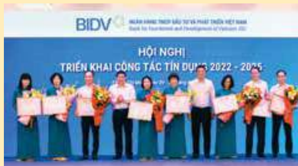
Vinh danh các đơn vị tại Trụ sở chính có nhiều đóng góp trong hoạt động tín dụng

Tại Hội nghị tín dụng, BIDV đã vinh danh các tập thể có nhiều đóng góp quan trọng trong hoạt động tín dụng của hệ thống giai đoạn 2019-2021. Đây là các đơn vị có hiệu quả tín dụng cao và đóng góp lớn vào lợi nhuận của hệ thống, thỏa mãn điều kiện nợ xấu và không nợ quỹ dự phòng rủi ro tín dụng.