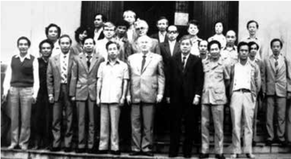
Cán bộ Ngân hàng Nhà nước cùng cán bộ Ngân hàng Đầu tư và Xây dựng Việt Nam chụp ảnh kỷ niệm với Đoàn cố vấn quốc tế sang giúp Ngân hàng Đầu tư và Xây dựng Việt Nam về nghiệp vụ (thời kỳ 1981-1985)

Thời gian như lửa thử vàng, 65 năm phát triển của BIDV là một hành trình dài với nhiều thành tựu và cả những khó khăn đã đúc kết nên một BIDV với 5 giá trị: Trí tuệ - Niềm tin - Liêm chính - Chuyên nghiệp - Khát vọng. Trong hành trình ấy, người BIDV đã và đang nhiều lần chứng minh rằng: Khi bạn thật sự mong muốn, thật sự có “Khát vọng”, bạn đã có một sức mạnh to lớn để vượt qua hoàn cảnh và vững vàng tiến lên.