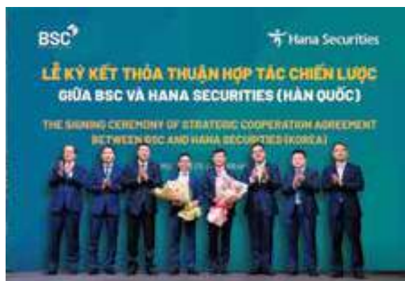
Lãnh đạo các đơn vị chúc mừng thành công Lễ ký kết thỏa thuận hợp tác chiến lược BSC và Hana Securities

Theo đó, khi chính thức trở thành cổ đông chiến lược của BSC, cùng với cổ đông lớn nhất là BIDV, Hana Securities sẽ đồng hành, hỗ trợ BSC triển khai một số nội dung như: (1) Thiết lập kế hoạch chiến lược và tầm nhìn; (2) Thiết lập chiến lược và kế hoạch số hóa; (3) Nâng cao chức năng quản lý tài sản với trọng tâm là tập trung vào hoạt động bán lẻ thông qua việc thành lập Công ty Quản lý Quỹ; (4) Cùng tham gia hoạt động quản lý tài sản và hỗ trợ thiết lập hệ thống hợp tác liên tục trong đầu tư thông qua việc thành lập Công ty Quản lý