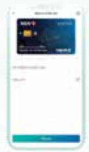
Bước 3 Tại màn hình Đặt mã PIN mới, Nhập thông tin xác thực gồm Số CMND/CCCD, Hộ chiếu và ngày sinh. Nhấn nút chức năng Tiếp tục