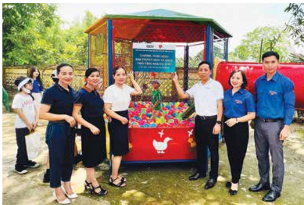
Đại diện Đoàn công tác của Ban Thư ký HĐQT&QHCD và Trường mầm non Tân Thịnh chụp ảnh lưu niệm bên công trình an sinh xã hội ý nghĩa

của huyện Định Hóa, nơi đây cuộc sống của người dân còn gặp nhiều khó khăn, vất vả... nên điều kiện cơ sở vật chất cho việc học tập cho các em nhỏ còn nhiều hạn chế. Trường mầm non xã Tân Thịnh được xây dựng từ năm 2001, cơ sở vật chất còn thiếu thốn, đặc biệt là các trang thiết bị dạy học, vui chơi cho các cháu cũng rất hạn chế, hầu hết đều là các món đồ do các cô giáo tự làm thủ công hoặc thuê gia công rất giản đơn, đến nay đã cũ hoặc hỏng không còn sử dụng được. Từ kết quả khảo sát trước đó, sau hơn 01 tháng chuẩn bị và thi công, công trình Khu vui chơi do Chi đoàn Ban Thư ký HĐQT&QHCD dành tặng cô trò Trường mầm non xã Tân Thịnh đã hoàn thành. Công trình được khánh thành, trao tặng trong dịp kỷ niệm 77 năm Cách mạng Tháng Tám và Quốc Khánh 2/9 thực sự là món quà ý nghĩa, thiết thực, mang lại niềm vui mới cho các em nhỏ ngay trước thềm năm học mới.