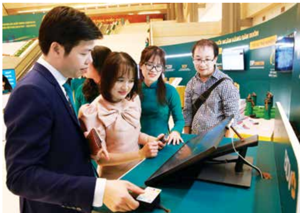
BIDV là ngân hàng đầu tiên phối hợp với Trung tâm Nghiên cứu, ứng dụng dữ liệu dân cư và CCCD - Bộ Công An (Trung tâm RAR) triển khai thành công việc ứng dụng CCCD gắn chip trên các giao dịch tại khu vực tự phục vụ của BIDV như ATM, E-Zone

Bên cạnh đó, BIDV cũng phối hợp với Tổng cục Thuế xây dựng các tính năng xác thực tài khoản thuế trực tuyến (Etax) và liên kết với tài khoản thanh toán tại BIDV giúp người dân thanh toán thuế dễ dàng, tiện lợi. Khách hàng có tài khoản tại BIDV có thể nộp thuế trực tuyến ngay trên ứng dụng Etax Mobile thay vì phải