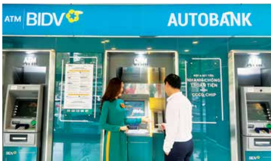
Hiện BIDV đang triển khai chấp nhận CCCD gắn chip trên kênh giao dịch tự động tại 09 điểm thuộc địa bàn Hà Nội, Quảng Ninh. Trong thời gian tới, BIDV sẽ tiếp tục phối hợp với Trung tâm RAR triển khai mở rộng trên toàn hệ thống và trên ứng dụng BIDV SmartBanking để gia tăng trải nghiệm của khách hàng khi sử dụng CCCD gắn chip trong giao dịch ngân hàng

Thứ ba: Ngân hàng Nhà nước nghiên cứu có hướng dẫn bổ sung các thông tư để tạo điều kiện cho hoạt động ngân hàng điện tử như cho vay, xác thực giao dịch bằng ứng dụng CCCD gắn chip được thuận tiện, nhanh chóng và đơn giản hơn. □