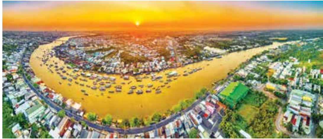
Du lịch là một trong những lĩnh vực được hỗ trợ lãi suất

Các NHTM đã vào cuộc rất tích cực như ban hành quy định nội bộ về triển khai chương trình HTLS; tổ chức tập huấn toàn hệ thống tới từng chi nhánh, phòng giao dịch; rà soát đối tượng thuộc các ngành, lĩnh vực được HTLS; chủ động thông tin, tuyên truyền đến khách hàng... Tuy nhiên, kết quả triển khai đến nay