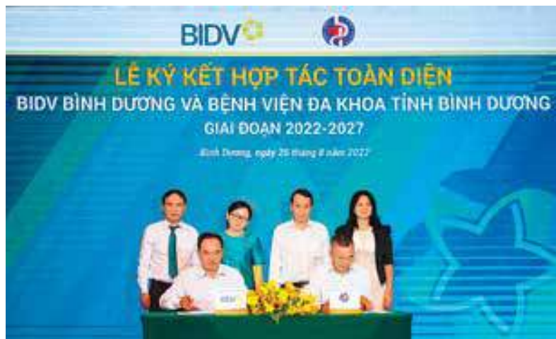
Đại diện Lãnh đạo BIDV Bình Dương và Bệnh viện đa khoa tỉnh Bình Dương ký kết thỏa thuận hợp tác toàn diện giữa hai đơn vị