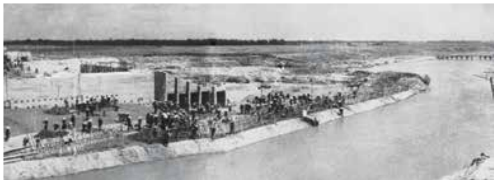
Hệ thống đại thủy nông Bắc - Hưng - Hải thời kỳ 1961-1965 do Ngân hàng Kiến thiết Việt Nam cấp phát vốn xây dựng

Bên cạnh việc đa dạng hóa các dịch vụ của một ngân hàng thương mại, BIDV chủ động, tiên phong ứng dụng CNTT vào hoạt động, đẩy mạnh phát triển dịch vụ ngân hàng, tham gia hình thành và phát triển mới các thị trường như cho thuê tài chính, bảo hiểm, chứng khoán... Ngoài khách hàng là các doanh nghiệp Nhà nước, BIDV đã mở rộng đối tượng tín dụng cho tất cả các thành phần kinh tế, phát huy tính sáng tạo, linh hoạt, góp phần vào thành công của công cuộc đổi mới đất nước.