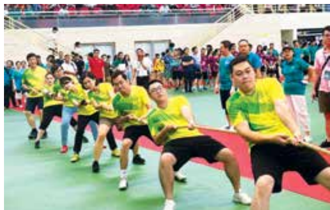
Các VĐV tranh tài môn thi kéo co tại Hội thao khu vực Hà Nội