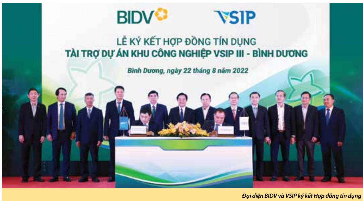
Đại diện BIDV và VSIP ký kết Hợp đồng tín dụng

Ngày 22/08/2022, tại Bình Dương, BIDV và Công ty Liên doanh TNHH Khu công nghiệp Việt Nam-Singapore (VSIP) tổ chức Lễ ký kết Hợp đồng tín dụng tài trợ Dự án đầu tư xây dựng Khu công nghiệp Việt Nam-Singapore III tại Bình Dương (VSIP III - Bình Dương).