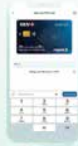
Bước 5 Tại màn hình xác thực, nhập mã OTP