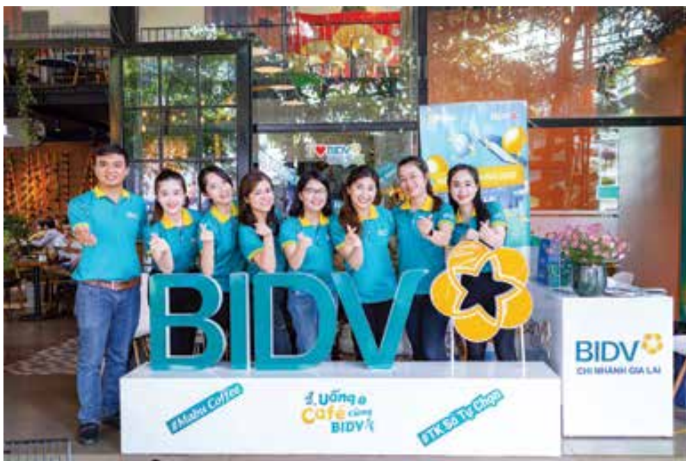
Cán bộ BIDV Gia Lai ra quân trong chiến dịch “Uống cà phê cùng BIDV”

T rong suốt quá trình hình thành và phát triển, BIDV Gia Lai luôn thực hiện nghiêm túc các chính sách và chỉ đạo của NHNN tỉnh, đồng hành cùng doanh nghiệp, người dân và chính quyền địa phương. Đến 30/06/2022, tổng tài sản của BIDV Gia Lai đạt 9.850 tỷ đồng, tổng huy động vốn đạt 5.510 tỷ đồng, dư nợ tín dụng đạt 9.400 tỷ đồng, thu dịch vụ đạt 14 tỷ đồng, chênh lệch thu chi đạt 227 tỷ đồng, nộp ngân sách 4 tỷ đồng.