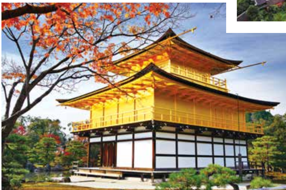
Chùa Vàng Kinkaku-ji - Di sản thế giới, di tích lịch sử của cố đô Kyoto, Nhật Bản