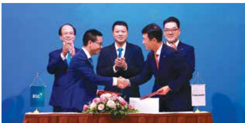
Lãnh đạo BSC và Hana Securities ký kết thỏa thuận hợp tác chiến lược

BSC và Công ty TNHH Chứng khoán Hana (Hana Securities) – thuộc Tập đoàn Tài chính Hana-Hàn Quốc (HFG) vừa tổ chức thành công Lễ ký kết thỏa thuận hợp tác chiến lược, vào ngày 3/8/2022 tại Hà Nội. Tham dự Lễ ký kết có đại diện Ban Lãnh đạo cấp cao HFG, Ngân hàng KEB Hana, BIDV, các khách hàng, cổ đông của BSC và các cơ quan thông tấn báo chí.