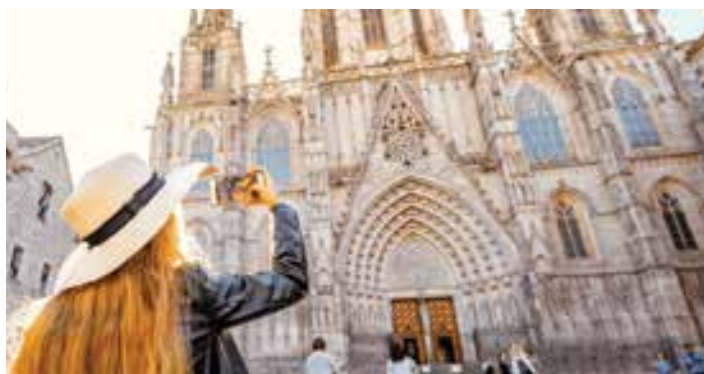
Khách du lịch cần lưu ý các quy định về quay phim, chụp ảnh khi tới thăm nhà thờ

Nếu đến thăm các quốc gia như Nepal, Ấn Độ, hay đảo Bali của Indonesia, chắc chắn bạn sẽ bắt gặp rất nhiều những dấu ấn kiến trúc và hoa văn đặc trưng của người Hindu. Hindu giáo hay còn gọi là Ấn Độ giáo là tôn giáo lâu đời nhất trên thế giới. Để thể hiện sự tôn trọng với các vị thần, bạn nên tắm rửa sạch sẽ thân thể trước khi bước vào một ngôi đền Ấn Độ giáo. Không mặc trang phục hoặc mang phụ kiện làm từ da bởi người Hindu rất tôn kính thần Bò. Khi dâng lễ, ngoài các vật