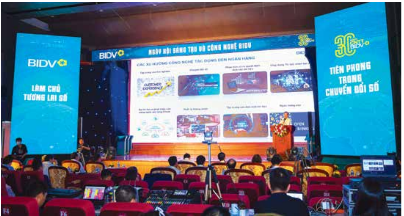
BIDV công bố Kiến trúc tổng thể, Chiến lược phát triển CNTT tại Ngày hội Sáng tạo và Công nghệ BIDV 2022