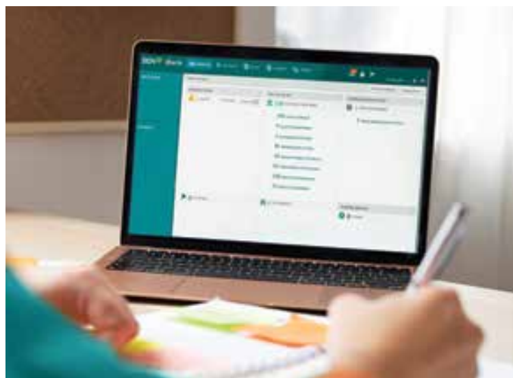
Chương trình Trade Booming mang đến nhiều ưu đãi hấp dẫn cho khách hàng

Thứ nhất: Giảm 50% phí dịch vụ (gồm cả mức phí tối đa, tối thiểu) khi đăng ký sử dụng mới dịch vụ Chuyển tiền quốc tế và Tài trợ thương mại trên BIDV iBank trong thời gian ưu đãi (áp dụng đối với các dịch vụ: Chuyển tiền quốc tế đi, Phát