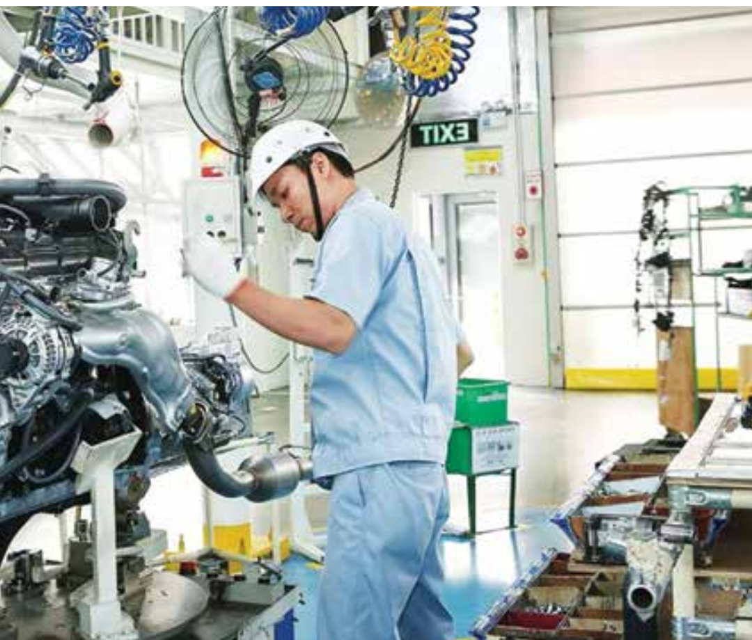
Lĩnh vực chế tạo phục hồi mạnh mẽ hậu Covid-19

biệt giữa chính sách tiền tệ, chính sách tài khóa và chính sách giá cả nhằm kiểm soát lạm phát, tỷ giá, lãi suất, ổn định kinh tế vĩ mô; tăng cường truyền thông nhằm giảm thiểu tâm lý lo ngại lạm phát và hiện tượng đầu cơ, găm giữ, buôn lậu gây bất ổn thị trường. Chú trọng điều tiết việc mua vật tư, thiết bị y tế và thuốc men nhằm đảm bảo đủ nguồn cung và tránh hiện tượng tăng giá bất hợp lý.