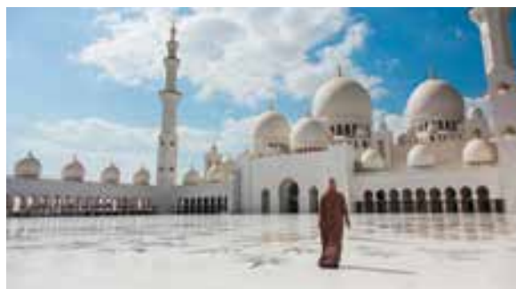
Du khách nữ đến thăm Thánh đường Hồi giáo Sheikh Zayed cần mặc trang phục trùm kín đầu

phẩm, đừng quên một vòng hoa cúc vạn thọ. Sau phần nghi lễ, các đền thờ thường chia đồ cúng cho du khách. Bạn hãy đón nhận bằng tay phải và thưởng thức sau khi rời khỏi đền.