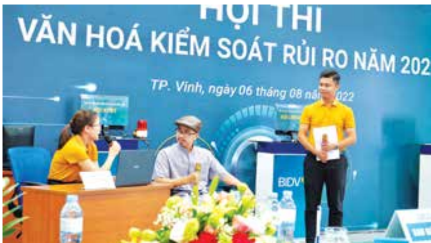
Cán bộ BIDV Thành Vinh tham gia Hội thi VHKSRR cấp cơ sở