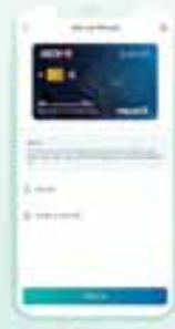
Bước 4 Tại màn hình Đặt mã PIN mới, nhập mã PIN từ 2 lần và nhấn nút chức năng Tiếp tục