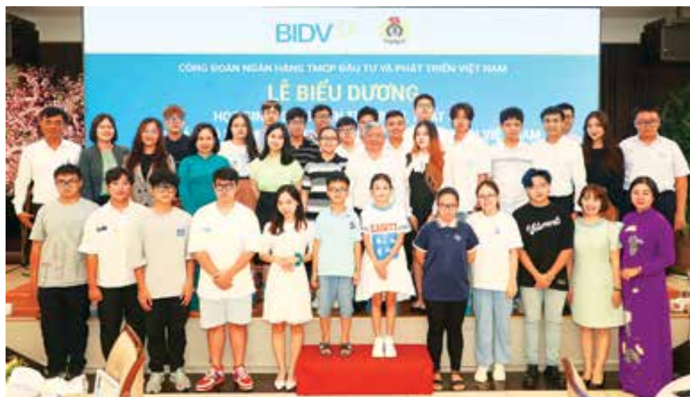
Đại diện Ban Lãnh đạo BIDV chụp ảnh lưu niệm cùng các cháu HSSV tiêu biểu giai đoạn 2019-2022

Không chỉ đạt các thành tích cao các môn về văn hóa, các cháu còn khẳng định ở các lĩnh vực nghiên cứu, ứng dụng khoa học vào cuộc