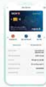
Bước 2 Tại màn hình Dịch vụ thẻ, Quý khách nhấn nút chức năng Đặt mã PIN mới