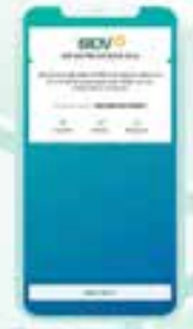
Bước 6 Màn hình báo đã thông báo kết quả giao dịch Đặt mã PIN thành công

Không cần phải trực tiếp ra ngân hàng hay gọi điện lên tổng đài 24/7, không cần phải chờ đợi từ 5-7 ngày sau khi đăng kí sử dụng thẻ để được nhận mã PIN qua đường bưu điện, giờ đây khách hàng sử dụng các loại thẻ của BIDV có thể chủ động nhận và đổi mã PIN chỉ với vài phút ngay trên ứng dụng BIDV SmartBanking. Chỉ cần đăng nhập BIDV SmartBanking trên điện thoại hoặc máy tính sau khi nhận được thẻ, khách hàng có thể dễ dàng nhận và đổi mã PIN trực tiếp thay vì mã PIN giấy như trước đây.