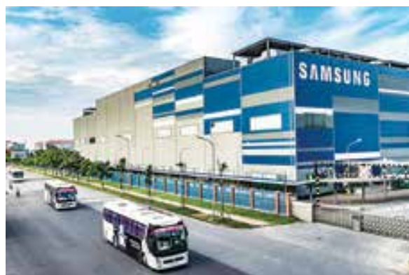
Samsung là một trong những tập đoàn đa quốc gia hoạt động tại Việt Nam

Về phía khách hàng, các doanh nghiệp Hàn Quốc sẽ được tiếp cận nguồn vốn (trong đó có nguồn ngoại tệ trung dài hạn từ các chi nhánh Hana Bank ngoài Việt Nam, trong bối cảnh các ngân hàng thương mại trong nước không được phép cấp tín dụng trung dài hạn bằng ngoại tệ kể từ tháng 10/2019 theo quy định của Ngân hàng Nhà nước Việt Nam) với chi phí hợp lý (trong tương quan so sánh với lãi suất cho vay VND, sau khi trừ đi chi phí hedging ngoại tệ). Hana Bank sẽ thu được lợi ích mở rộng nền khách hàng, quy mô tín dụng, hiểu biết hoạt động tại một nền kinh tế phát triển nhanh như Việt Nam, có thu