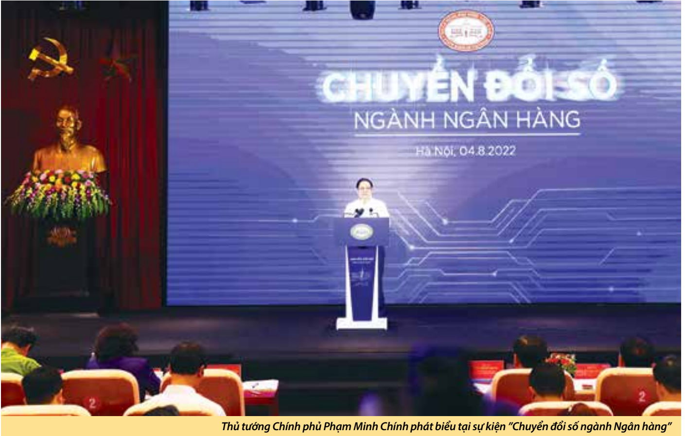
Thủ tướng Chính phủ Phạm Minh Chính phát biểu tại sự kiện “Chuyển đổi số ngành Ngân hàng”