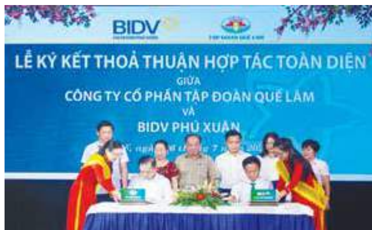
Đại diện Lãnh đạo BIDV Phú Xuân và Công ty Cổ phần Tập đoàn Quế Lâm ký kết thỏa thuận hợp tác toàn diện giữa hai đơn vị

Nhân dịp này, BIDV Bình Dương đã trao tặng 970 triệu đồng hỗ trợ hoạt động thường xuyên của Bệnh viện đa khoa tỉnh Bình Dương nhằm nâng cao chất lượng khám chữa bệnh tại khu điều trị và khu cấp cứu của bệnh viện.