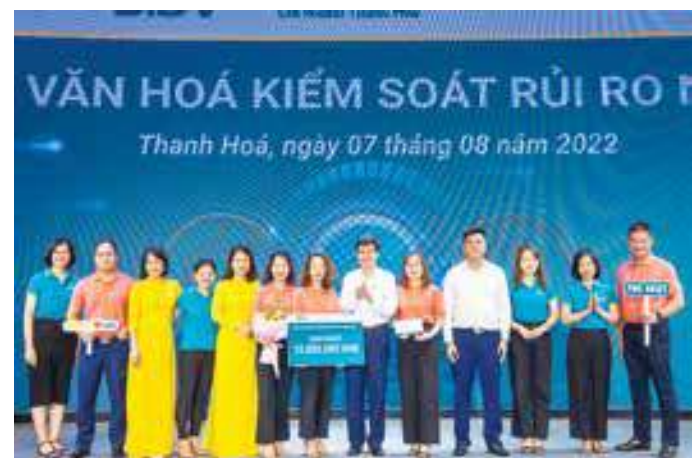
BIDV Thanh Hóa trao giải Hội thi VHKSRR cấp cơ sở

Kết quả chung cuộc, giải Nhất thuộc về đội The Best, các giải còn lại thuộc về các đội: FireWall (giải Nhì), Táo Family (giải Ba), Nhận - Thái - Hành (giải Đội thi được yêu thích nhất). Cũng tại hội thi, Ban Tổ chức đã trao giải cho 2 cán bộ có thành tích xuất sắc tại vòng thi online Qbizz tổ chức ngày 22/6/2022. Kinh doanh ngân hàng là ngành nghề kinh doanh đặc thù, tiềm ẩn rủi ro cao. Vì vậy, bên cạnh việc nâng cấp, hoàn thiện quy trình, nghiệp vụ, tăng cường công tác giám sát, thanh kiểm tra nội bộ, đảm bảo sự minh bạch và thông suốt thông tin; việc xây dựng, lan toả những giá trị cốt lõi về kiểm soát rủi ro là vấn đề cần đặc biệt chú trọng. Hy vọng sau cuộc thi mỗi cán bộ sẽ tự trang bị cho mình thêm nhiều kiến thức và kỹ năng để xử lý rủi ro. Từ đó, góp phần đưa BIDV Thanh Hoá đạt được những mục tiêu kinh doanh mới an toàn và bền vững.