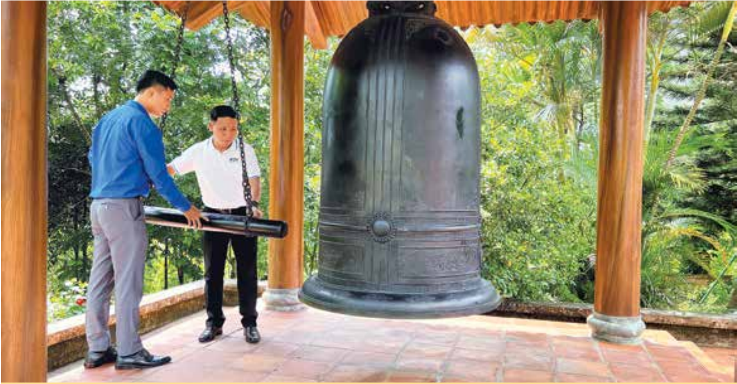
Đoàn công tác Ban Thư ký HDQT&QHCD trong chuyến đi về nguồn