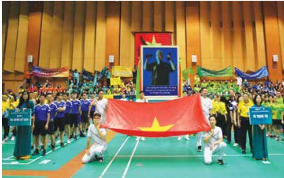
Khai mạc Hội thao khu vực Trụ sở chính

Trong 2 ngày 27-28/8/2022, Hội thao khu vực Trụ sở chính diễn ra tràn ngập niềm vui với sự tham gia của 8 đội, quy tụ gần 700 vận động viên đến từ 40 Công đoàn cơ sở Ban/Trung tâm Trụ sở chính, tranh tài 6 môn thi đấu. Hội thao kết thúc để lại dấu ấn sâu sắc về tinh thần đoàn kết, ý chí thi đấu cao độ của các vận động viên. Kết quả chung cuộc, giải Nhất toàn đoàn thuộc về Khối Bán buôn & Kinh doanh vốn; giải Nhì thuộc về Khối Quản lý rủi ro & Trung tâm Phê duyệt tín dụng; giải Ba thuộc về Khối Tác nghiệp, Khối Bán lẻ; giải Khuyến khích thuộc về Khối Công nghệ thông tin & Ngân hàng số, Khối Tài chính Kế toán, Khối Hỗ trợ, Khối Đầu tư – Pháp chế và Giám sát tuân thủ - Ban trực thuộc HĐQT. Đặc biệt, Hội thao khu vực Trụ sở chính còn trao tặng giải “Đội cổ vũ phong cách nhất” cho Khối Tài chính Kế toán và giải “Đội cổ vũ truyền cảm hứng” cho Khối Công nghệ thông tin & Ngân hàng số.