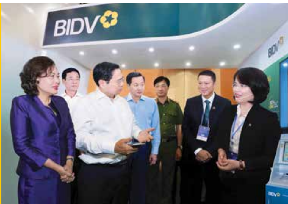
Thủ tướng Chính phủ Phạm Minh Chính cùng các đồng chí Lãnh đạo Chính phủ, NHNN trải nghiệm không gian giao dịch CCCD gắn chip của BIDV tại sự kiện “Chuyển đổi số ngành Ngân hàng”

T hủ tướng Phạm Minh Chính nhấn mạnh: Chuyển đổi số là xu thế tất yếu, khách quan trong quá trình phát triển, là yêu cầu bắt buộc, cấp thiết, tác động tới tất cả mọi người dân, mọi hoạt động của nền kinh tế. Do đó, chúng ta phải có cách tiếp cận toàn dân, người dân là trung tâm thì mọi hoạt động chuyển đổi số phải hướng tới người dân, người dân là chủ thể thì mọi người dân phải được tham gia và hưởng lợi; chỉ có như vậy thì chuyển đổi số mới thành công.