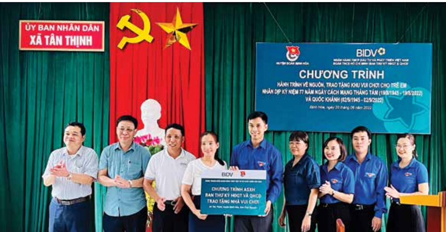
Đại diện Đoàn công tác Ban Thư ký HĐQT&QHCD trao quà anh sinh xã hội

của huyện Định Hóa, nơi đây cuộc sống của người dân còn gặp nhiều khó khăn, vất vả... nên điều kiện cơ sở vật chất cho việc học tập cho các em nhỏ còn nhiều hạn chế. Trường mầm non xã Tân Thịnh được xây dựng từ năm 2001, cơ sở vật chất còn thiếu thốn, đặc biệt là các trang thiết bị dạy học, vui chơi cho các cháu cũng rất hạn chế, hầu hết đều là các món đồ do các cô giáo tự làm thủ công hoặc thuê gia công rất giản đơn, đến nay đã cũ hoặc hỏng không còn sử dụng được. Từ kết quả khảo sát trước đó, sau hơn 01 tháng chuẩn bị và thi công, công trình Khu vui chơi do Chi đoàn Ban Thư ký HĐQT&QHCD dành tặng cô trò Trường mầm non xã Tân Thịnh đã hoàn thành. Công trình được khánh thành, trao tặng trong dịp kỷ niệm 77 năm Cách mạng Tháng Tám và Quốc Khánh 2/9 thực sự là món quà ý nghĩa, thiết thực, mang lại niềm vui mới cho các em nhỏ ngay trước thềm năm học mới.