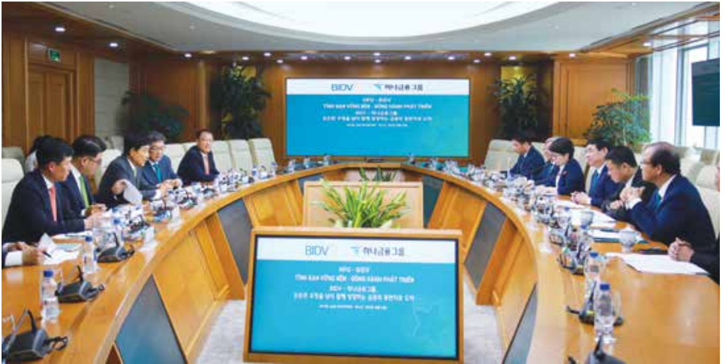
BIDV와 하나금융그룹 회담

한국으로부터의 FDI 유입의 중요한 위치와 역할, 그리고 한국 기업이 베트남 경제에 긍정적인 기여를 하고 있다는 점을 감안할 때, BIDV는 계속해서 한국 기업을 주요한 고객으로 관리하고 있다.