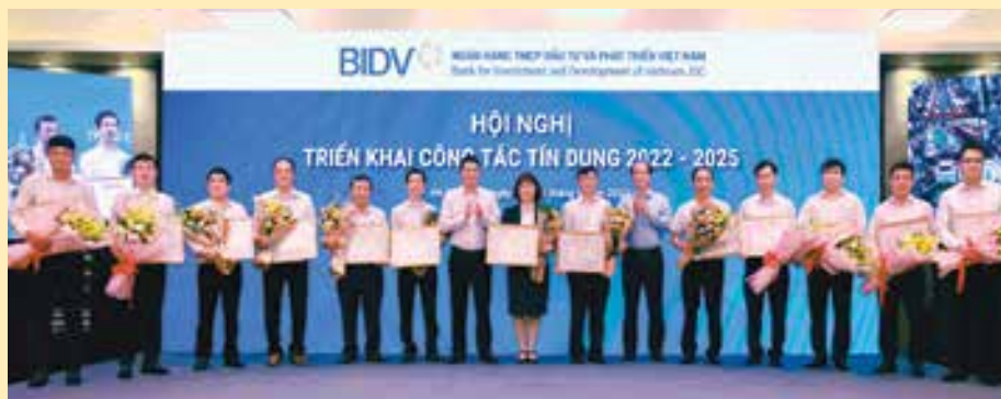
Vinh danh các chi nhánh có nhiều đóng góp trong hoạt động tín dụng