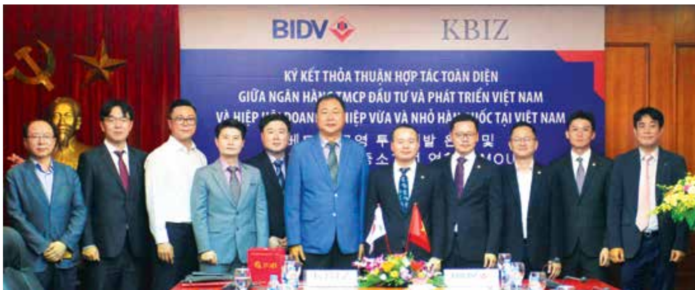
BIDV và KBIZ tại Việt Nam ký thỏa thuận hợp tác toàn diện năm 2020 tại Hà Nội