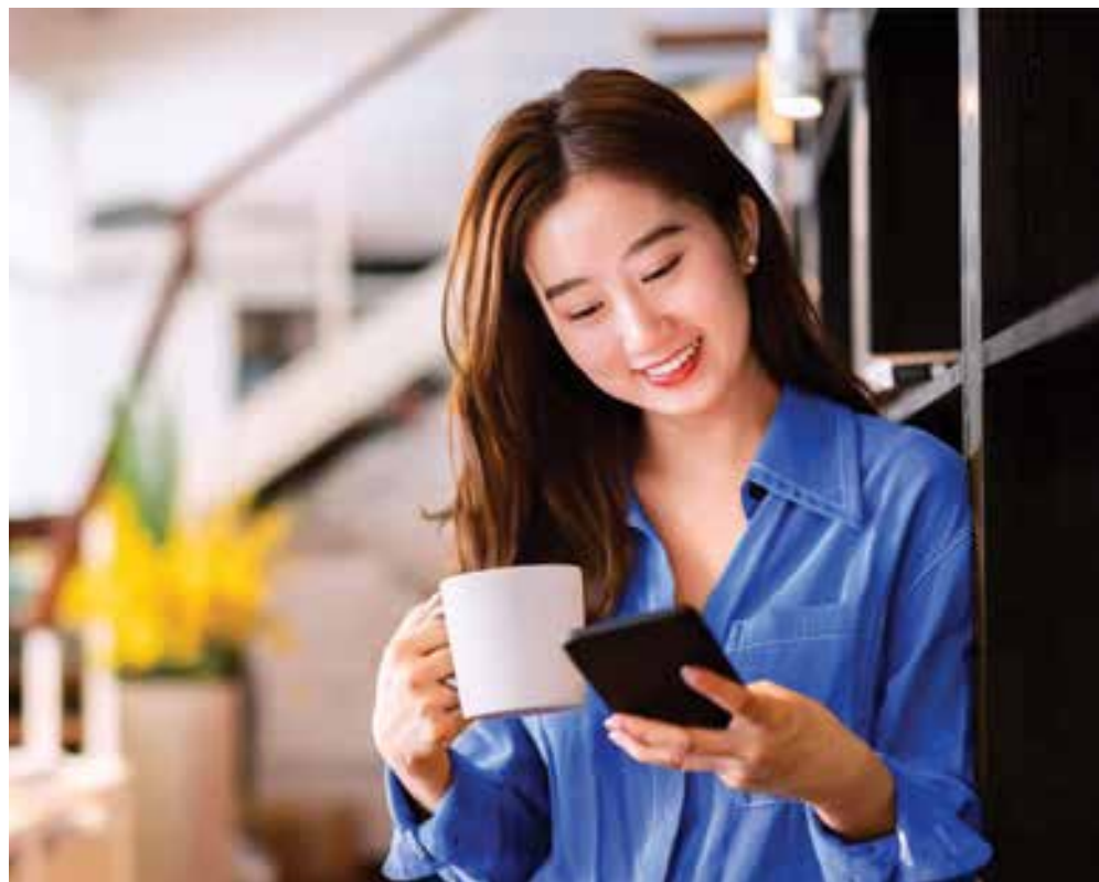
BIDV nâng tầm trải nghiệm cho khách hàng