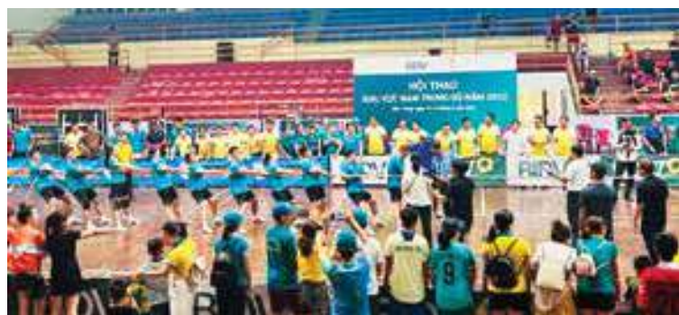
Các VĐV tranh tài môn thi kéo co tại Hội thao khu vực Nam Trung Bộ