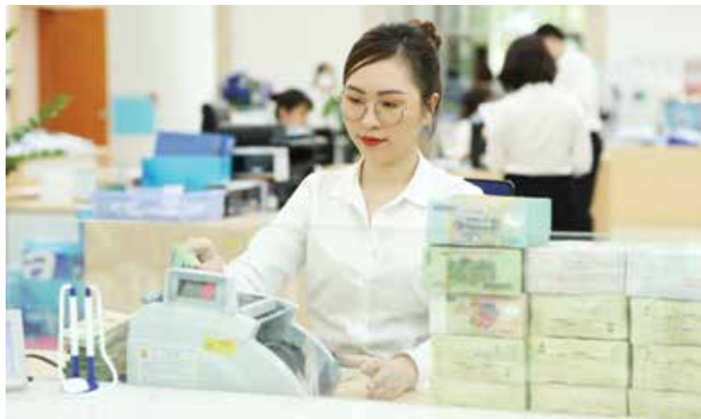
Chương trình hỗ trợ lãi suất 2% theo Nghị định 31 và Thông tư 03 có tổng ngân sách lên đến 40 nghìn tỷ đồng

Không chỉ ngân hàng, bản thân các doanh nghiệp cũng lo ngại thủ tục phức tạp, rườm rà; khi tham gia chương trình HTLS lại bị cơ