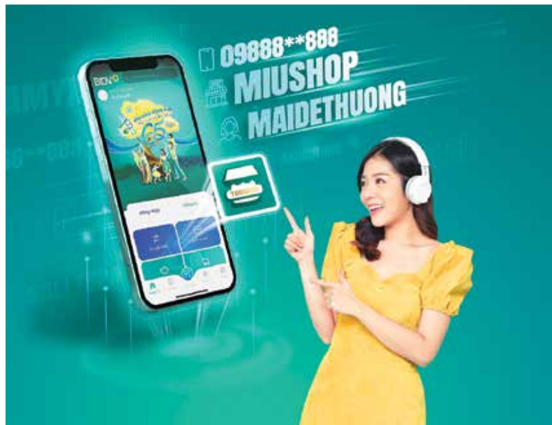
BIDV miễn phí Tài khoản Chọn tên Như ý từ nay đến hết 30/09/2022

Với định hướng trở thành ngân hàng có nền tảng số tốt nhất Việt Nam, ngân hàng số thế hệ mới BIDV SmartBanking đang là dịch vụ duy nhất hỗ trợ khách hàng giao dịch liền mạch và đồng nhất trên các thiết bị: điện thoại di động, máy tính, laptop, máy tính bảng, đồng hồ thông minh (Apple Watch) và bàn phím thông minh (SmartKeyboard). Theo đó, BIDV SmartBanking đã mở rộng định nghĩa về ngân hàng số