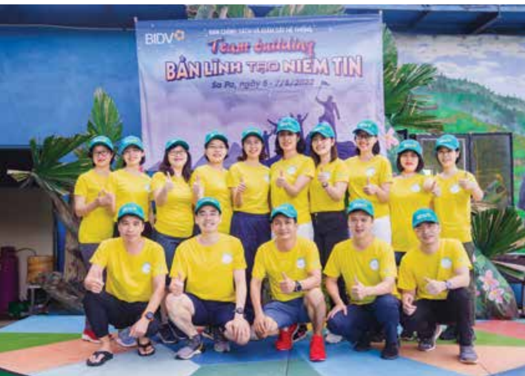
Hoạt động team building giúp gắn kết các thành viên Ban CS&GSHT

Tiết trời những ngày cuối hạ, đầu thu thật phù hợp cho những chuyến đi xa. Không bỏ lỡ thời khắc giao mùa đặc biệt ấy, Ban Chính sách và Giám sát hệ thống (CS&GSHT) đã thực hiện hành trình đầu tiên với nhiều xúc cảm đặc biệt. Chuyến đi là cơ hội để các thành viên rèn luyện thêm “Bản lĩnh”, tạo thêm “Niềm tin”; đúng với ý nghĩa của Slogan của Ban CS&GSHT: “Bản lĩnh tạo niềm tin”.