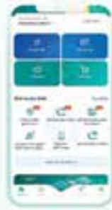
Bước 1 Đăng nhập ứng dụng SmartBanking. Chọn Dịch vụ thẻ