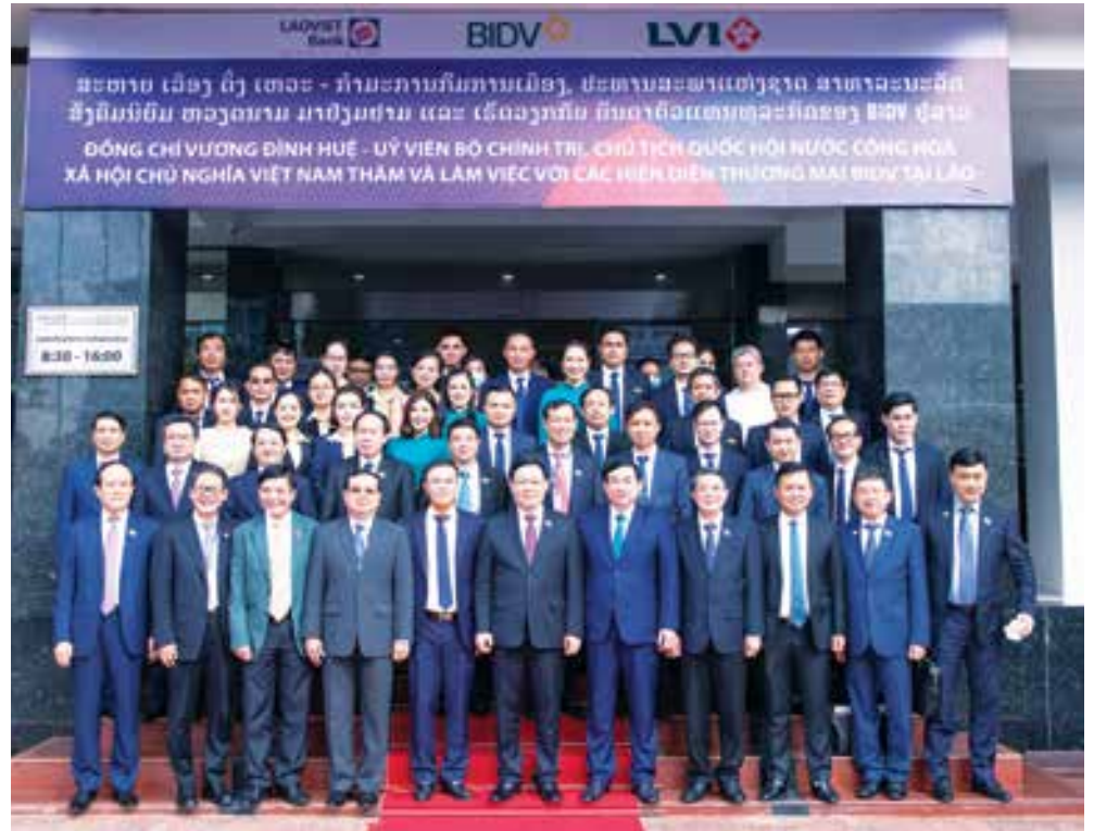
Chủ tịch Quốc hội Vương Đình Huệ đến thăm, làm việc tại LVB

Đặc biệt, năm 2022 là năm mang nhiều ý nghĩa khi được xác định là năm “Đoàn kết hữu nghị Việt Nam - Lào 2022” - kỷ niệm 60 năm Ngày thiết lập quan hệ ngoại giao (5/9/1962 - 5/9/2022) và 45 năm Ngày ký Hiệp ước Hữu nghị và Hợp tác Việt Nam - Lào (18/7/1977 - 18/7/2022). Nhiều hoạt động chính trị - ngoại giao các cấp giữa hai nước đã được tổ chức, nổi bật như: Chủ tịch Quốc hội Vương Đình Huệ thăm và làm việc tại Lào từ 15 - 18/5/2022; Thủ tướng Lào Phankham Viphavanh thăm và làm việc tại Việt Nam từ 8 - 10/01/2022... Cùng với đó, quan hệ đầu tư - thương mại Việt - Lào tiếp tục đạt được nhiều kết quả quan trọng.