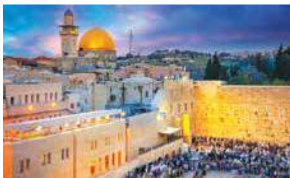
Bức tường phía Tây ở thành cổ Jerusalem