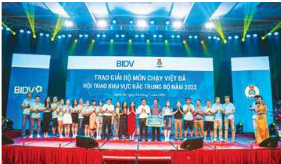
Ban Tổ chức trao giải tại Hội thao khu vực Bắc Trung Bộ