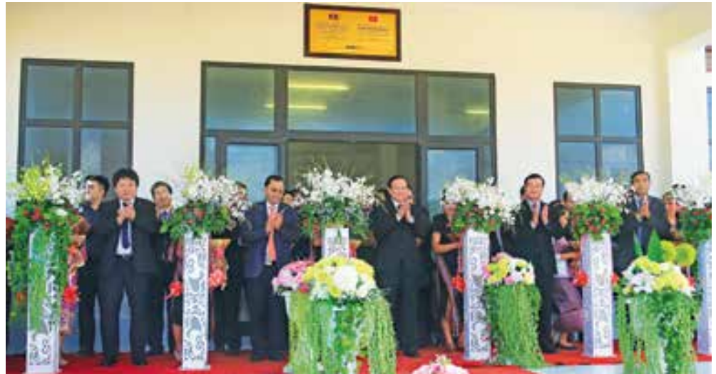
Các đại biểu cắt băng khánh thành công trình phòng học do BIDV tài trợ tại Trường THPT Dakcheung, tỉnh Sekong, Lào

Văn phòng đại diện BIDV tại Lào là cánh tay nối dài của BIDV triển khai các hoạt động đối ngoại, an sinh xã hội tại Lào; phối hợp, hỗ trợ tích cực và hiệu quả hoạt động của các hiệp hội nhà đầu tư, doanh nghiệp trong