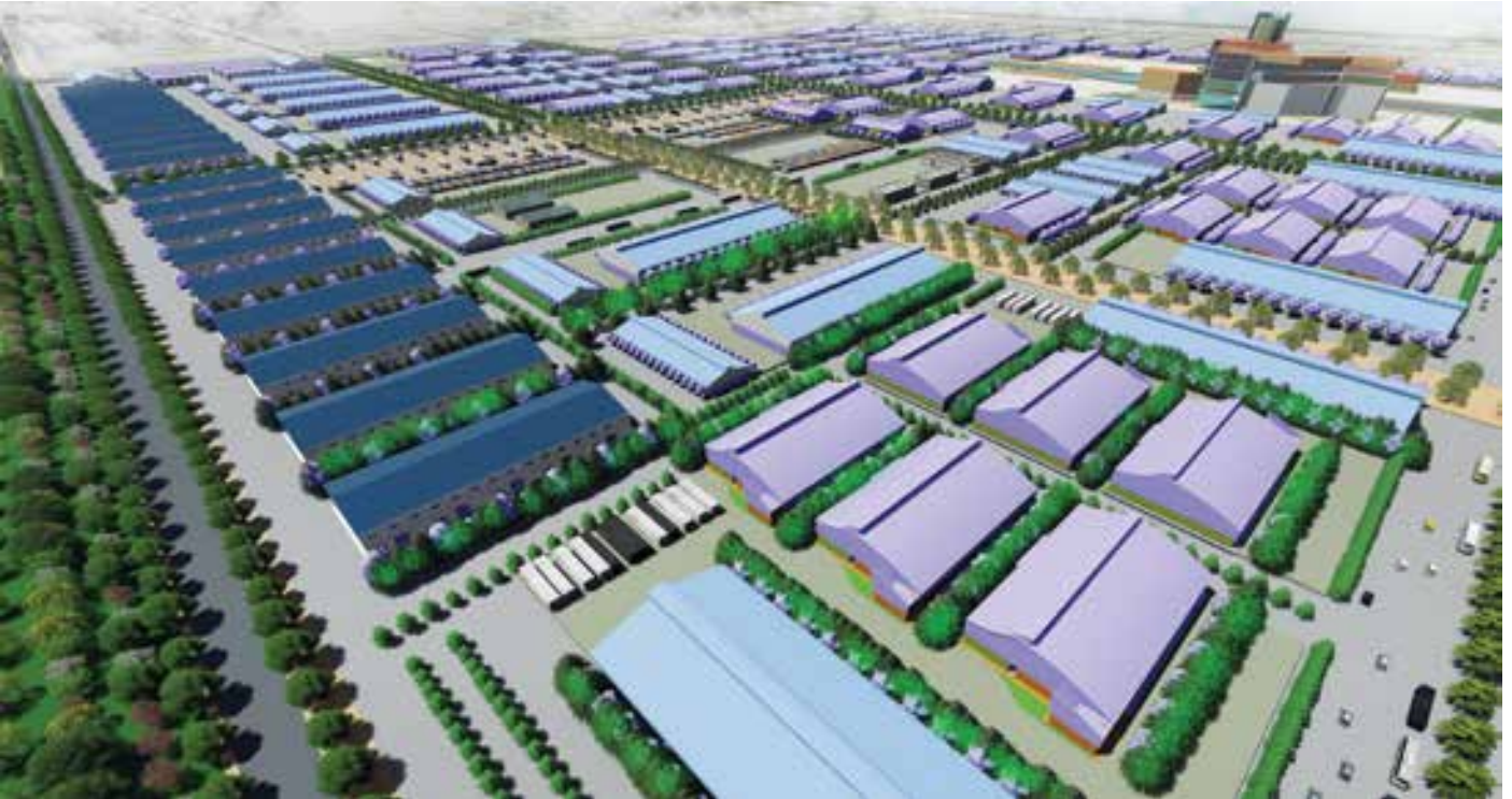
Phối cảnh KCN VSIP III – Bình Dương được xây dựng trên quỹ đất 1.000ha tại phường Hội Nghĩa, thị xã Tân Uyên và xã Tân Lập, huyện Bắc Tân Uyên, tỉnh Bình Dương

Sự hợp tác giữa BIDV và VSIP khởi nguồn từ năm 2003 nhằm phát triển VSIP I tại Bình Dương. Năm 2006, hai đơn vị tiếp tục song hành phát triển VSIP II, VSIP II – A và liên tục mở rộng sự hợp tác trên cả nước với VSIP Quảng Ngãi (2013) và VSIP Nghệ An (2015). Sau gần 20 năm đồng hành, BIDV và VSIP tiếp tục thắt chặt mối quan hệ đối tác chiến lược giữa hai đơn vị khi tiến hành ký kết Hợp đồng tín dụng tài trợ phát triển Khu công nghiệp VSIP III – Bình Dương với tổng số tiền tài trợ lên tới 4.600 tỷ đồng (tương đương khoảng 200 triệu USD).