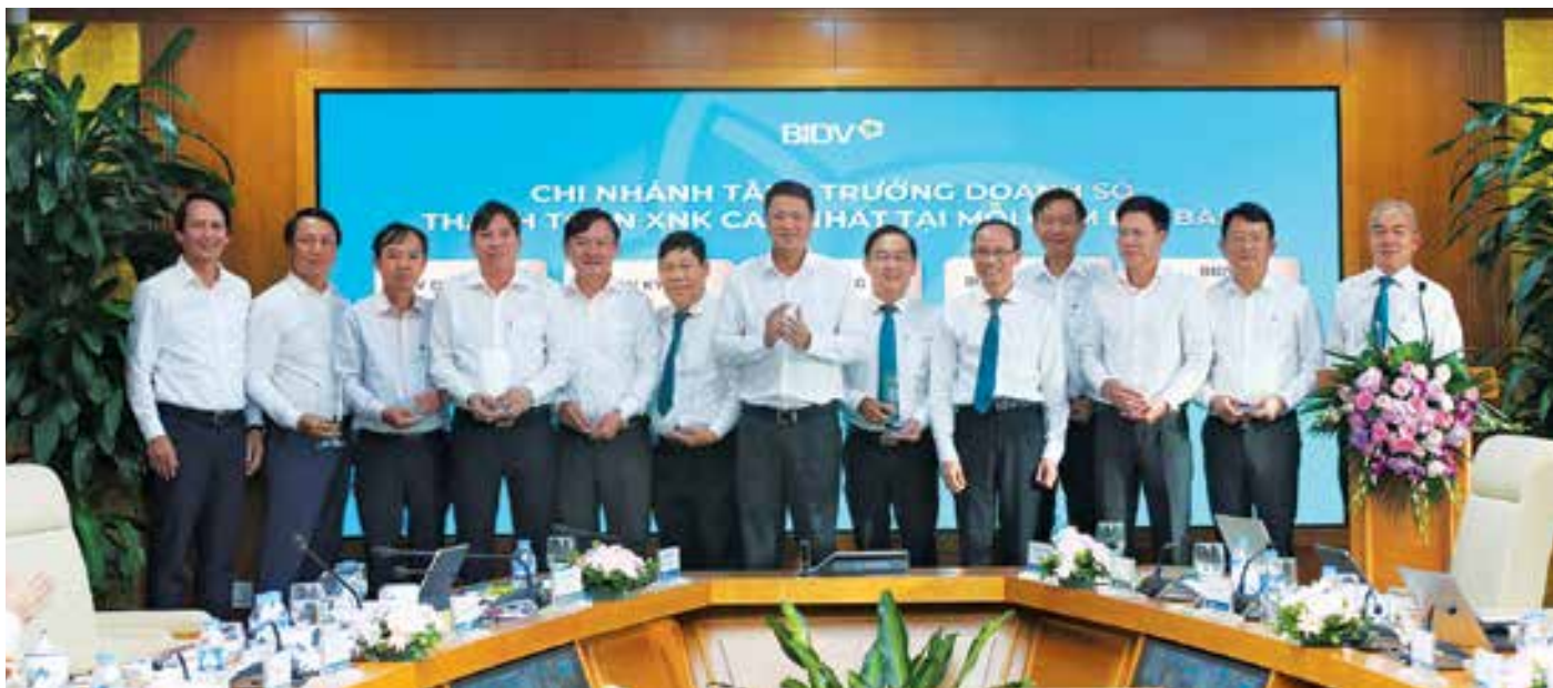
Hội thảo vinh danh 10 chi nhánh tăng trưởng doanh số thanh toán XNK cao nhất tại mỗi cụm địa bàn

TTTM của BIDV cũng khá đầy đủ, cạnh tranh, vấn đề đặt ra bây giờ là các chi nhánh phải vào cuộc để gia tăng nền khách hàng, đặc biệt là phân khúc khách hàng FDI, đẩy mạnh triển khai các sản phẩm TTTM có khả năng thay thế cho vay truyền thống để tạo tiền đề gia tăng thị phần, đồng thời các đơn vị Trụ sở chính cũng cần rà soát, đánh giá để tinh giản quy trình, đơn giản thủ tục hồ sơ để gia tăng hơn nữa khả năng cạnh tranh trong dịch vụ chuyển tiền quốc tế.