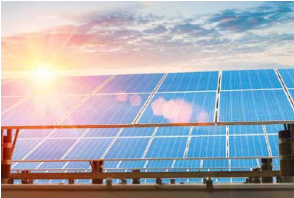
Thiết bị năng lượng mặt trời giúp giảm lượng phát thải khí các-bon