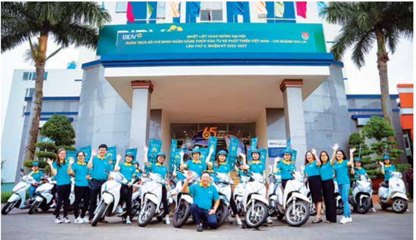
BIDV Gia Lai tham gia chiến dịch “Uống café cùng BIDV”

Bán hàng trúng đích, khơi gợi và đáp ứng đúng nhu cầu của khách hàng bằng sự thấu hiểu thị hiếu kết hợp với nét đặc trưng văn hóa địa phương không chỉ giúp các chi nhánh BIDV khu vực Tây Nguyên gây “thương nhớ” mà còn thuyết phục được khách hàng về “chung một nhà”. Đó chính là những gì mà chiến dịch “Uống café cùng BIDV” sẽ triển khai lần đầu tiên tại địa bàn Tây Nguyên.