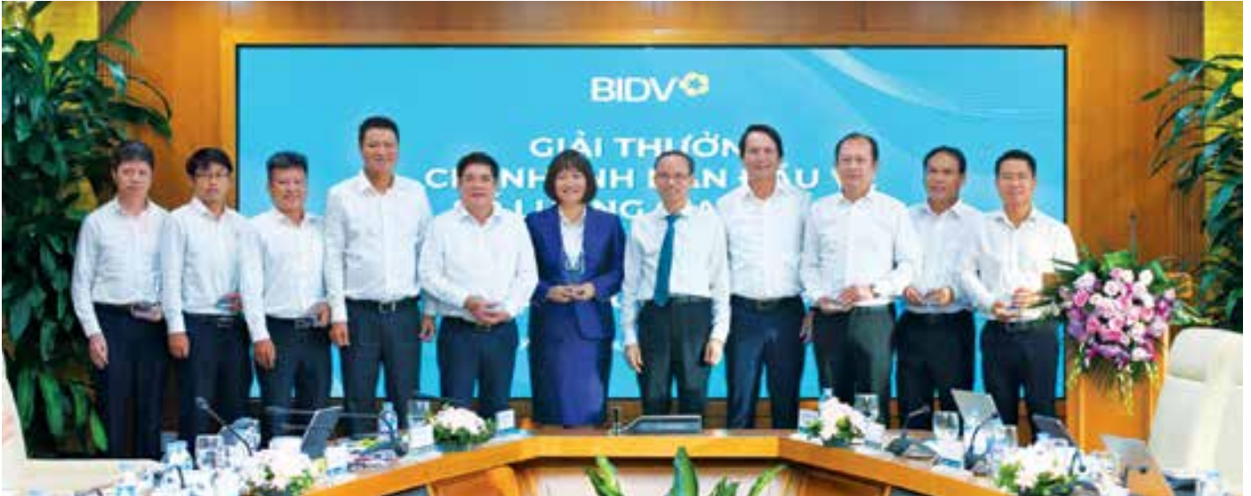
Hội thảo vinh danh 08 chi nhánh dẫn đầu về số lượng giao dịch trong chiến dịch TradeUp - giai đoạn 1

→ có thể tạo lợi thế cạnh tranh bằng cách nắm rõ lĩnh vực kinh doanh và mối quan tâm của khách hàng. Đặc biệt, cần xử lý hồ sơ một cách chuyên nghiệp, khoa học, chính xác và kịp thời. Khách hàng cần giao dịch ngay sau khi chốt giá với nhà cung ứng, nhất là trong giai đoạn thị trường biến động như hiện nay.