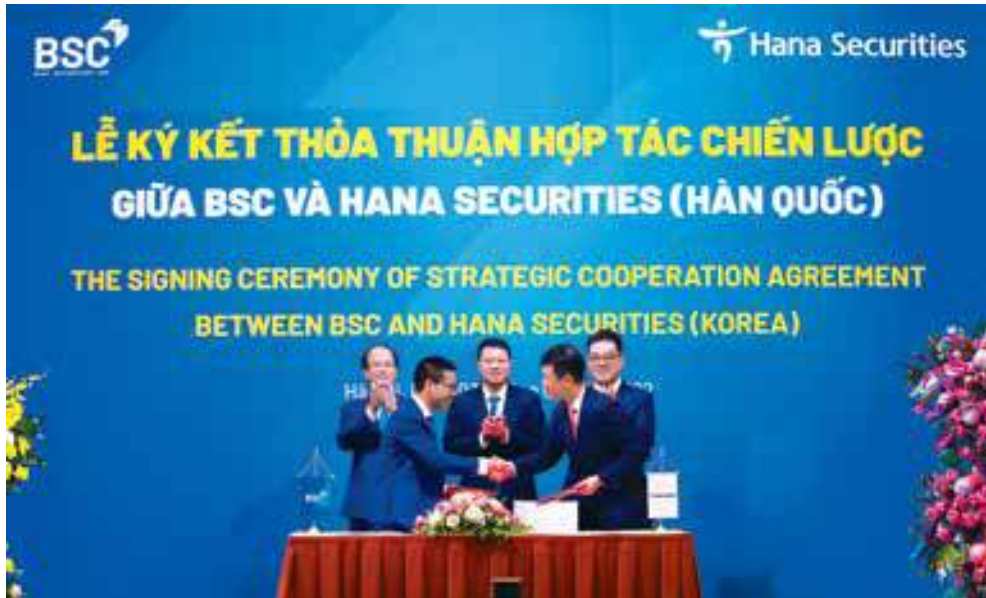
BSC와 하나증권 체결식

약은 베트남 은행업계 사상에 최대 규모의 전략적 M&A 거래를 성사시킨 이후 BIDV와 하나금융그룹의 특별하고 강력한 파트너십을 입증하는 유력한 증거이기도 하다.