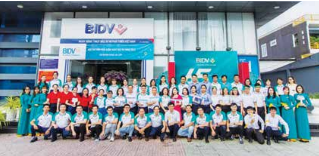
Tập thể BIDV Đông Sài Gòn