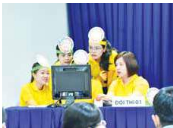
Cán bộ BIDV Tiền Giang tham gia Hội thi VHKSRR cấp cơ sở

Không phụ lòng Ban Tổ chức và khán giả, Hội thi VHKSRR cấp cơ sở