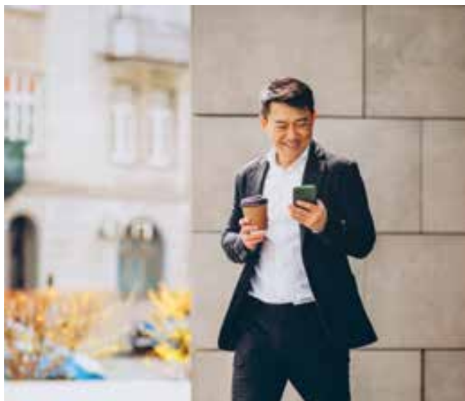
BIDV SmartBanking mang đến trải nghiệm vượt trội cho khách hàng

Hiện nay, BIDV đã và đang tiếp tục phối hợp rất chặt chẽ với Bộ Công an để triển khai và tích hợp các dữ liệu trên CCCD điện tử với các ứng dụng của ngân hàng. BIDV cũng tiên phong trong triển khai dịch vụ thanh toán trực tuyến dịch vụ công cấp độ 3, 4; Phối hợp với Tổng cục Thuế xây dựng các tính năng kết nối giữa tài khoản thuế của người dân với tài khoản của ngân hàng một lần duy nhất để thực hiện các giao dịch thuế. Việc ứng dụng dữ liệu CCCD đã giúp BIDV hoàn thiện và phát triển kỹ năng