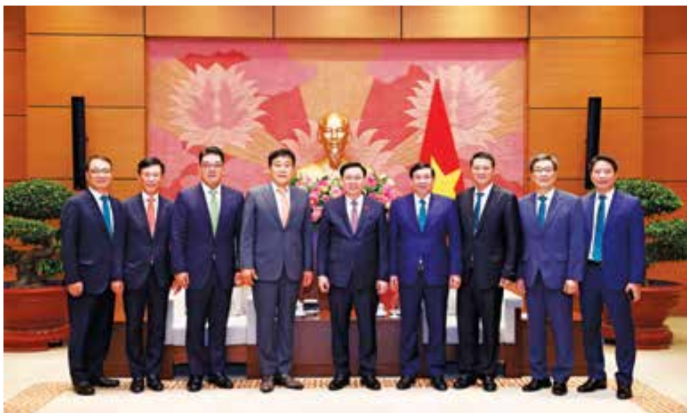
Chủ tịch Quốc hội Vương Đình Huệ chụp ảnh lưu niệm cùng lãnh đạo Tập đoàn Tài chính Hana và BIDV