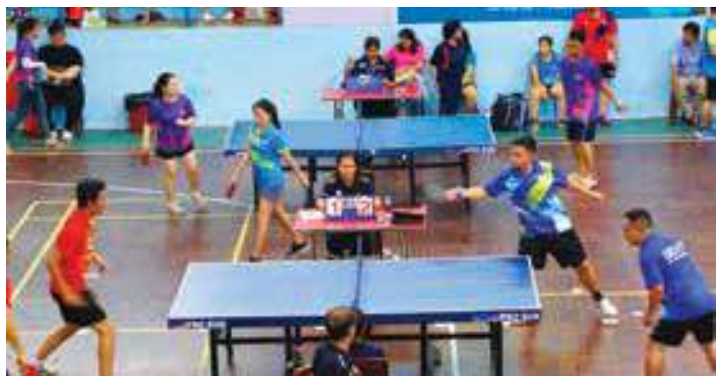
Các VĐV thi đấu môn bóng bàn tại Hội thao khu vực Đông Nam Bộ

Trải qua 3 ngày tranh tài sôi nổi (12-14/8/2022) ở 6 môn thi đấu (bóng đá, cầu lông, bóng bàn, tennis, kéo co và chạy bộ), các đội tham gia Hội thao khu vực Đông Nam Bộ đã thể hiện lối chơi đa dạng, đẹp mắt, cùng tinh thần thi đấu nhiệt huyết, sôi nổi, cao thượng. Gần 700 vận động viên là đoàn viên, người lao động BIDV tại 16 chi nhánh khu vực Đông Nam Bộ tham gia thi đấu đã thể hiện được tính tập thể, đoàn kết, hiệu quả và mang đậm bản sắc văn hóa BIDV, góp phần tạo nên thành công rực rỡ của Hội thao BIDV năm 2022. Kết thúc Hội thao, BIDV Bình Dương đạt giải Nhất toàn đoàn, BIDV Mỹ Phước đạt giải Nhì và BIDV Đồng Nai đạt giải Ba.