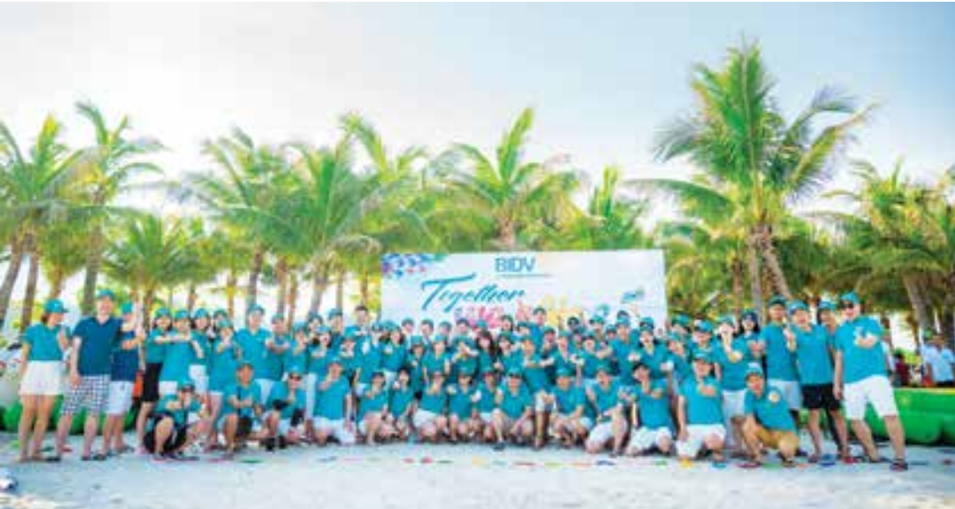
Tập thể cán bộ, nhân viên BIDV Ngọc Khánh Hà Nội

Sáu năm không phải là một hành trình dài với ngành ngân hàng nói chung và 65 năm của BIDV nói riêng, nhưng với BIDV Ngọc Khánh Hà Nội, đó là chặng đường vững bước cho khát vọng vươn lên, đóng góp tích cực vào kết quả kinh doanh của toàn hệ thống.