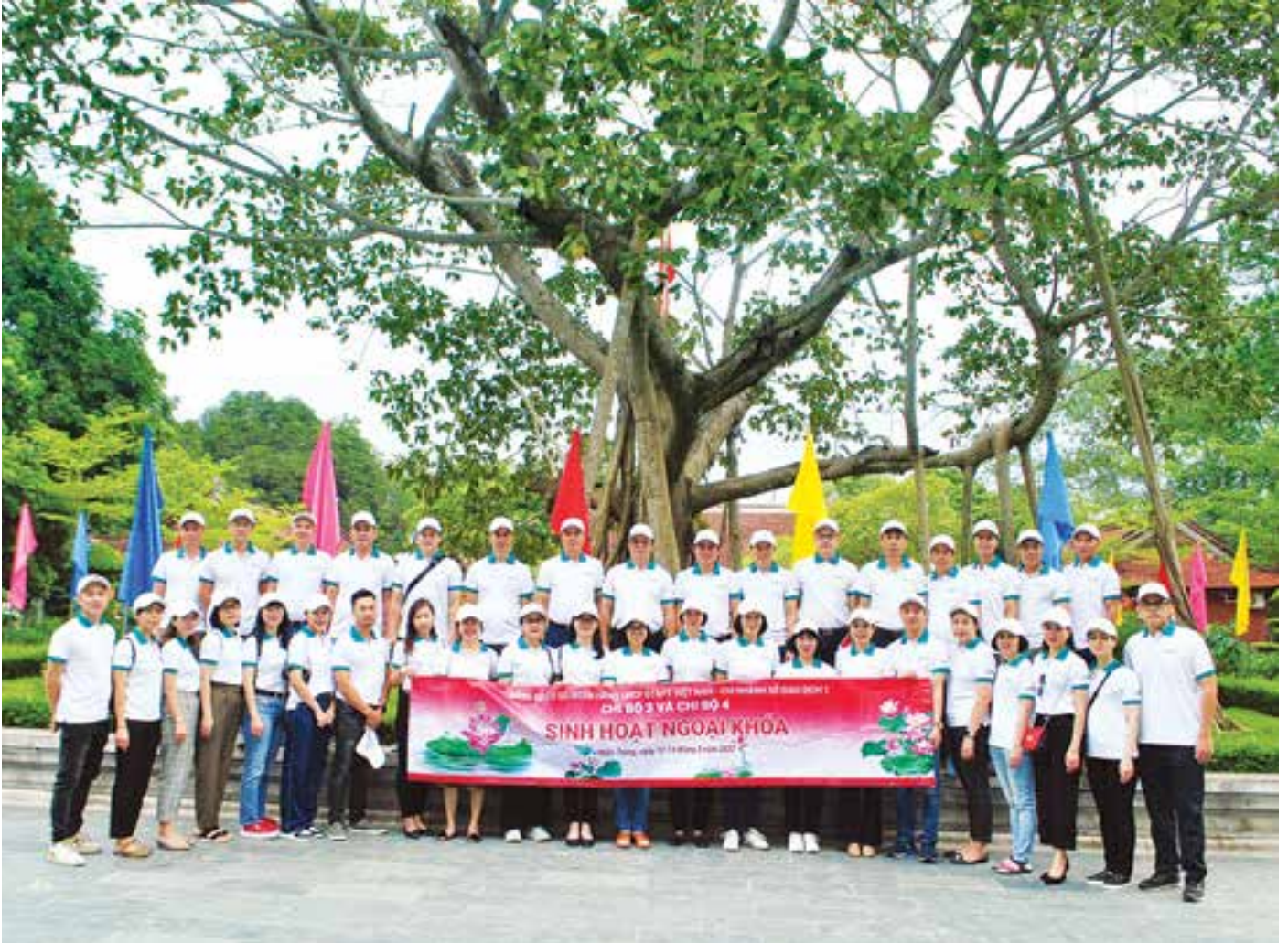
Chi bộ 3 và 4 thuộc Đảng bộ cơ sở BIDV Sở Giao dịch 1 trong chuyến đi về nguồn