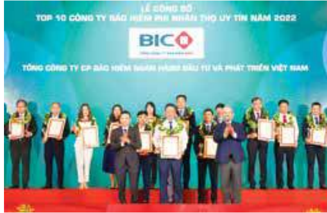
Đại diện Lãnh đạo BIC nhận chứng nhận Top 10 công ty bảo hiểm phi nhân thọ uy tín nhất Việt Nam

Top 10 công ty bảo hiểm phi nhân thọ uy tín nhất Việt Nam là kết quả nghiên cứu độc lập của Vietnam Report, được xây dựng theo các nguyên tắc khách quan và khoa học. Uy tín của công ty bảo hiểm được đánh giá dựa trên 3 tiêu chí chính: Thứ nhất, căn cứ trên kết quả hoạt động kinh doanh, năng lực tài chính của công ty bảo hiểm, có so sánh, đối chiếu và đánh